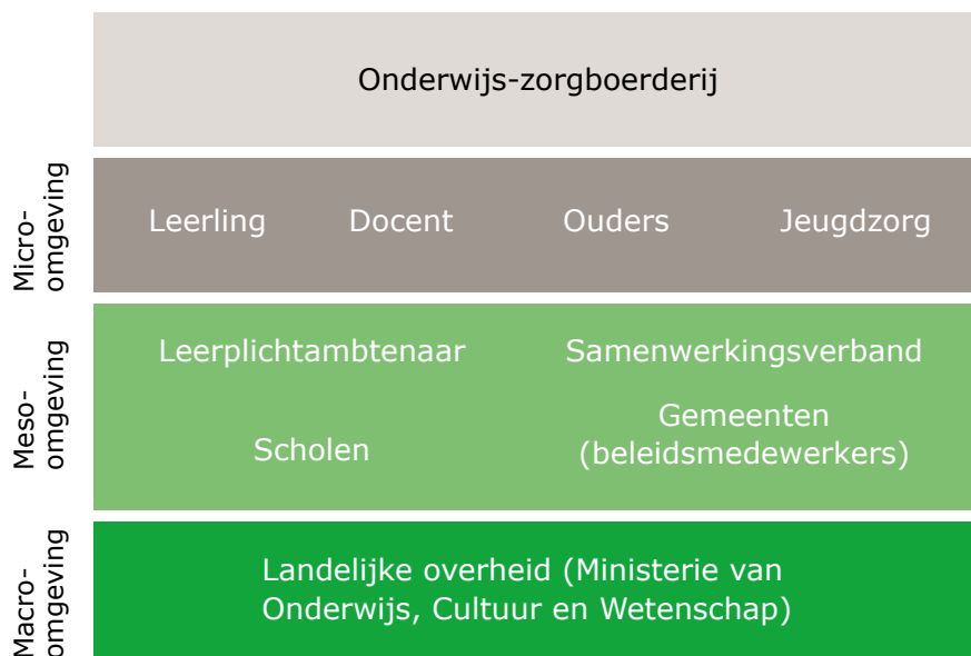
Figuur 1: Betrokken stakeholders

Ongeveer de helft van de onderwijs-zorgboeren geeft aan dat het onderwijs gefinancierd wordt door gemeenten. De andere helft ontvangt een vorm van financiering vanuit het onderwijs (via school of samenwerkingsverband).