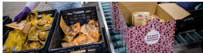
▲ Het jaarlijkse inpakken van de tienduizenden kerstpakketten voor de voedselbank is begonnen in Ahoy.